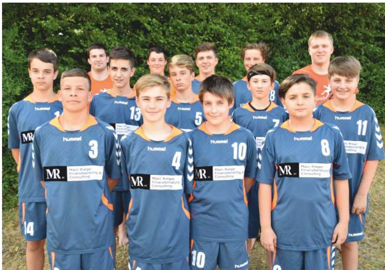
mJC - Bezirksliga