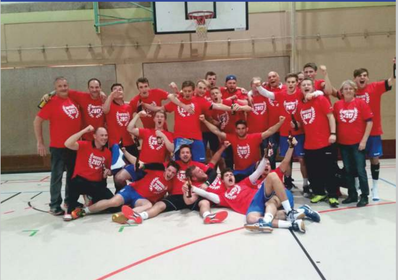
Männer 1 - Meister Bezirksliga 2016/17