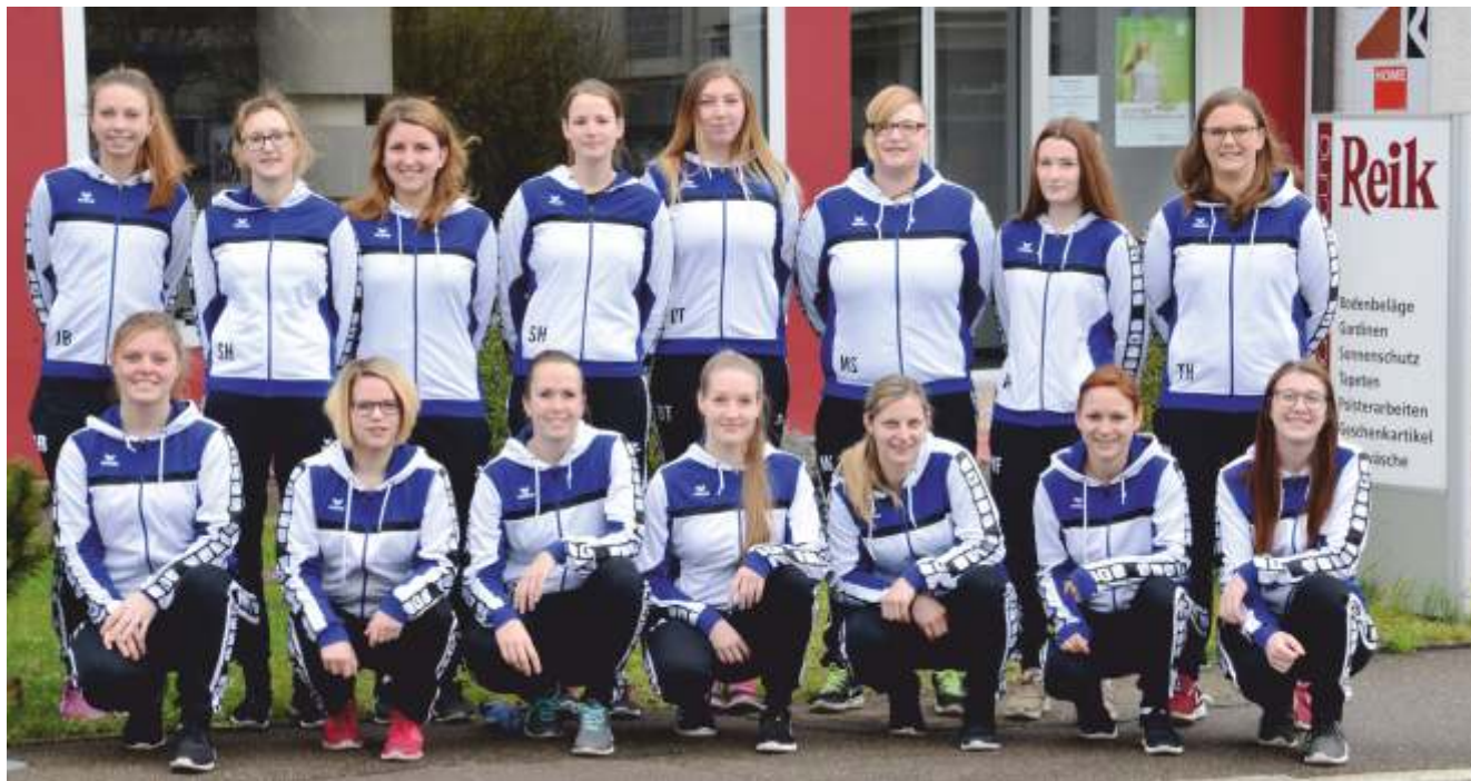
Frauen - Kreisliga