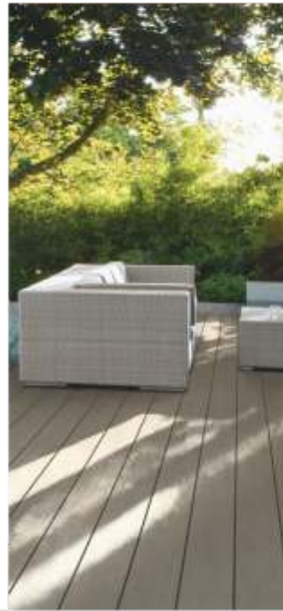
Holz im Garten