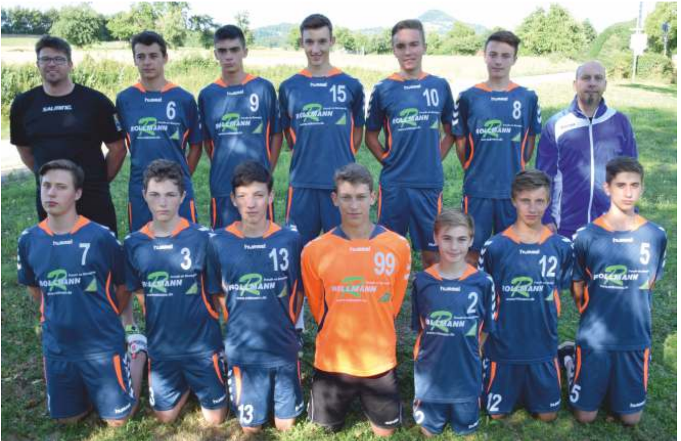
mJB - Bezirksliga