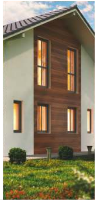
Bauen mit Holz