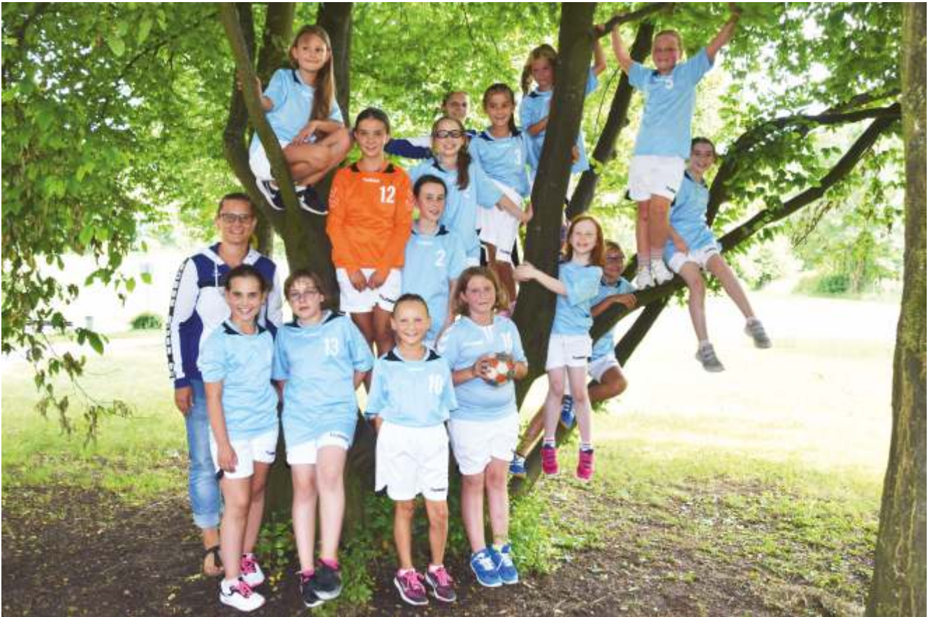
WJE - 6+1