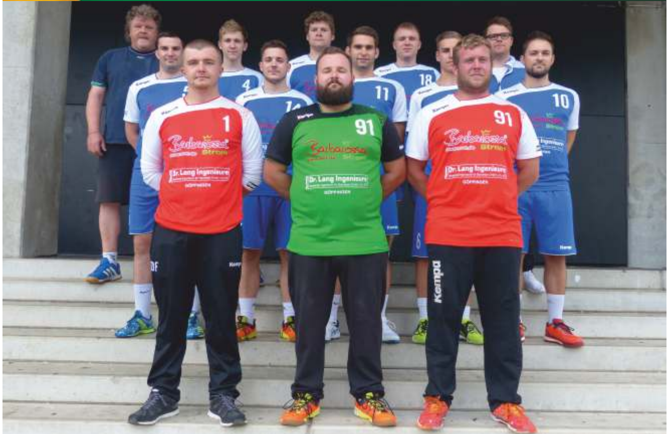
Männer 1 - Landesliga