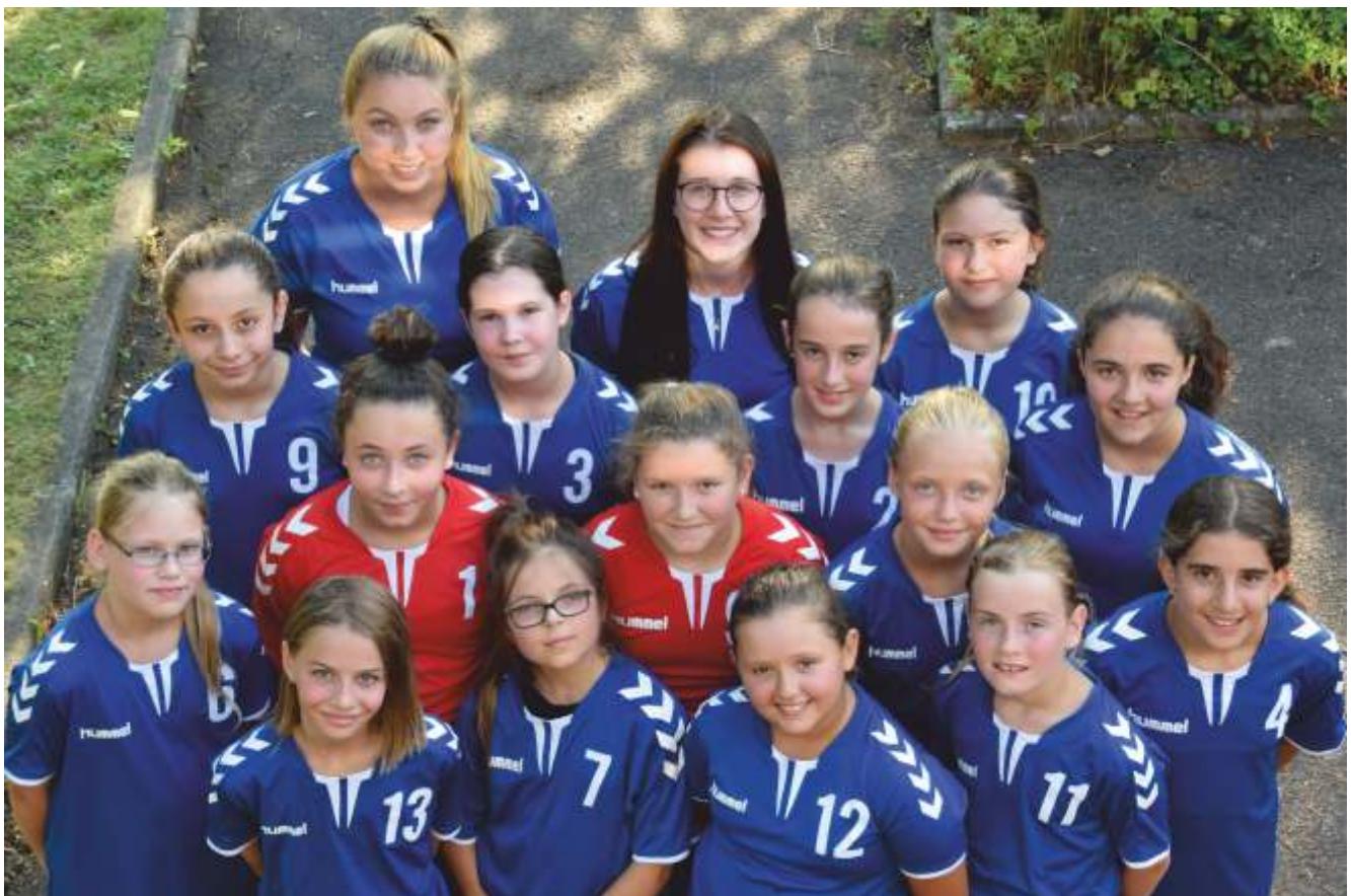
wJD - Bezirksklasse